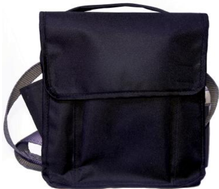
Сумка электромонтажника BODYGUARD